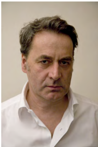
Bernhard Prinz, Künstler, Professor für Fotografie und Schirmherr der "gute aussichten_plattform4"

Ganz im Zeichen der deutsch-französischen Begegnung und des Austausches steht in diesem Jahr die "gute aussichten_plattform4" für junge Fotograf/inn/en, die in Strasbourg und Offenburg stattfindet. In freundlicher Zusammenarbeit mit La Chambre , Strasbourg, und unter dem Patronat von Bernhard Prinz , Fotograf, Künstler und Professor für Fotografie sowie Valérie Belin , Fotografin, Paris, widmen wir uns 5 Tage lang den aktuellen Fragen der Fotografie und den jeweiligen länderspezifischen Besonderheiten.