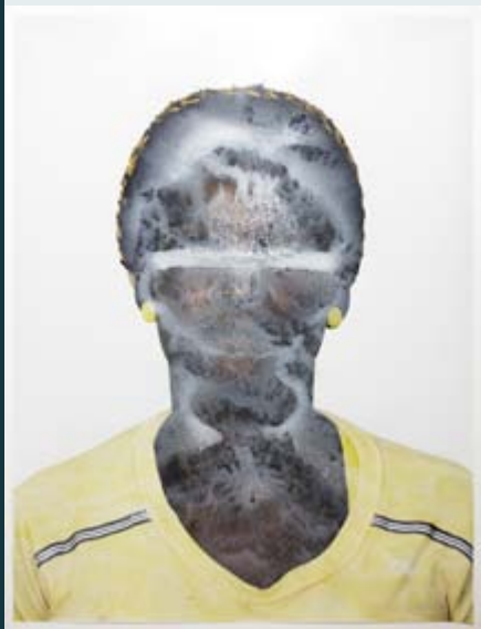
Chicks, Rags, Hopes von Nicolai Rapp