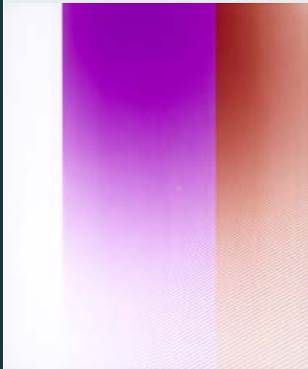
Digits of Light von Kolja Linowitzki