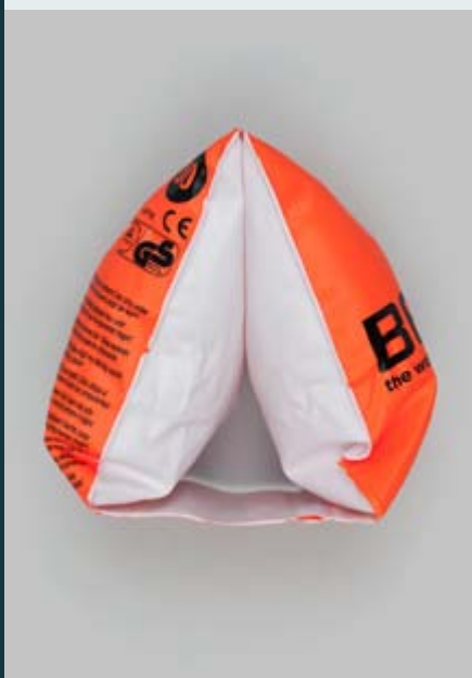
FUN-GBH-EAT von Claudia Christoffel

photography beyond the Düsseldorf School spiegelt den Fortbestand und Wandel des Mediums Fotografie in all seinen Facetten und bietet einen einzigartigen Überblick über eine Generation von jungen Fotografen, die das Primat der Düsseldorfer Schule hinter sich gelassen hat und sich visuell k in der Gegenwart verortet. So hat sich die zeitgenössische Fotografie vom reinen Abbild längst verabschiedet. Die durch Düsseldorf Schule postulierte Objektivität des Bildes ist – tr oder gerade wegen der anhaltenden Bilderflut auf allen media Kanälen – dahin.