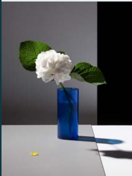
Some Flowers von Felix Dobbert