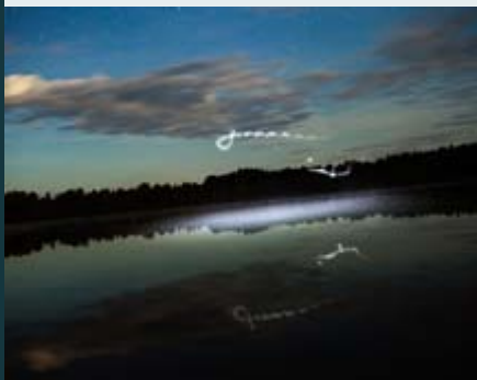
Svetloyar von Jewgeni Roppel

Handykamera, Internet und Social Media so selbstverständlich wie allgegenwärtig geworden. Ein bevorzugtes Sujet ist dabei das Selfie: DAS zeitgenössische Medium der Selbstinszenierung dessen Bild zwar individuell erscheint, aber einem Archetypus entspricht. Es geht somit viel weniger um das Foto als Abbild der Selbst, als um den Vorgang des Fotografierens an sich, der, frei nach René Descartes „cogito ergo sum“, besagt: ICH bin (da). Fotografieren im digitalen Zeitalter wird damit allem voran zu einer (sozialen) Handlung, die zur Bespielung der digitalen Kanäle wie Facebook, Instagram oder Snapchat dient.