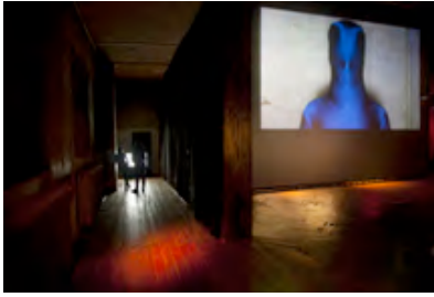
... Schroeders Film "Ein Bild abgeben"