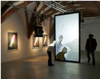
... in Szene gesetzt