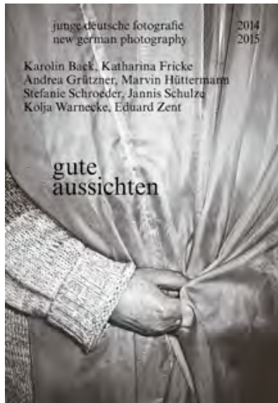
gute aussichten 2014/2015 Katalog

Jetzt: Eduard Zents "Moderne Tradition" 978-3-86490-226-0.