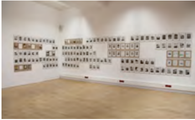
... Sennestadt fotografisch inszeniert

(über)sehen. Sie hat „danebengeschaut“, sich dem Üblichen entzogen und dieses, wie im Vorübergehen, in ihren Fotografien eingefangen.