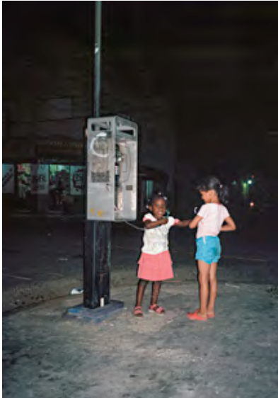
Zwischen Hoffnung und Vorurteil: Jannis Schulze Arbeit "Quisqueya"