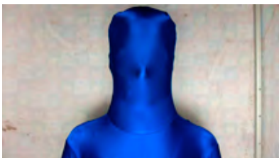
Auch im Ganzkörperanzug immer voller Einsatz: Ein Motiv aus Stefanie ...

Acht Jahre lang hat Stefanie Schroeder die Jobs dokumentiert, die sie neben ihrem Kunststudium ausgeübt hat. In sachlichem Tonfall, zwischen Beklemmung und absurder Komik, führt der Film "Ein Bild abgeben" vor, wozu die Fotografie im Stände ist: Sie dient als Beweis- und Anlagemittel, als Pressefoto, als leere Hülle und Camouflage, wird zum Andenken, Werbepäsent oder Bild-Brezelherz degradiert. "Ein Bild abgeben" zeigt uns Fotografieren als Handlung. Eine teilnehmende (Selbst-)Beobachtung der Fotografin, die damit offenlegt, dass Fotografie nicht nur Bilder hervorbringt, sondern auch immer von sich selbst ein Bild abgibt – in jeder Hinsicht.