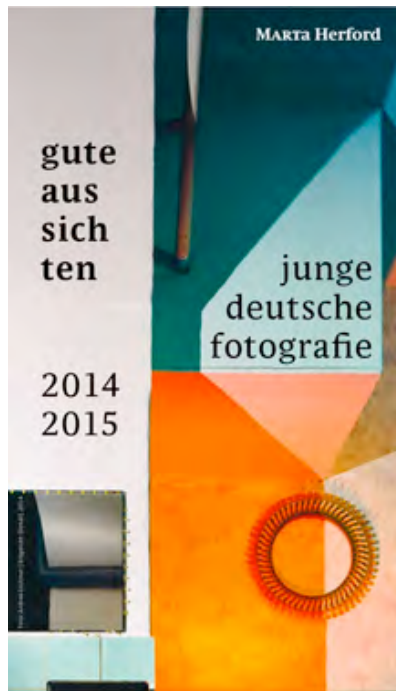
Einladungskarte zur ersten gute aussichten 2014/2015 Ausstellung ins Marta Herford

➔ AKTUELL ARCHIV PRESSEKIT PRESSESPIEGEL KONTAKT