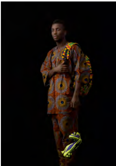
Zwischen gestern und heute im Hier und