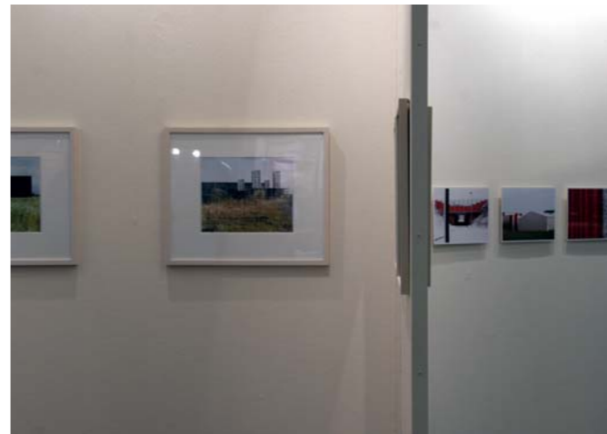
Frankfurter Buchmesse gute aussichten, Halle 4.0, Gang D gegenüber von Arvato