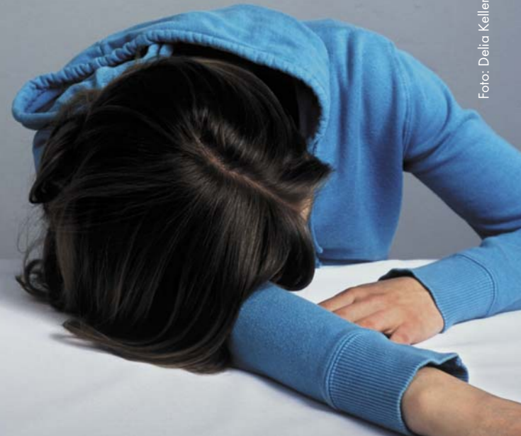
Alice, 2005