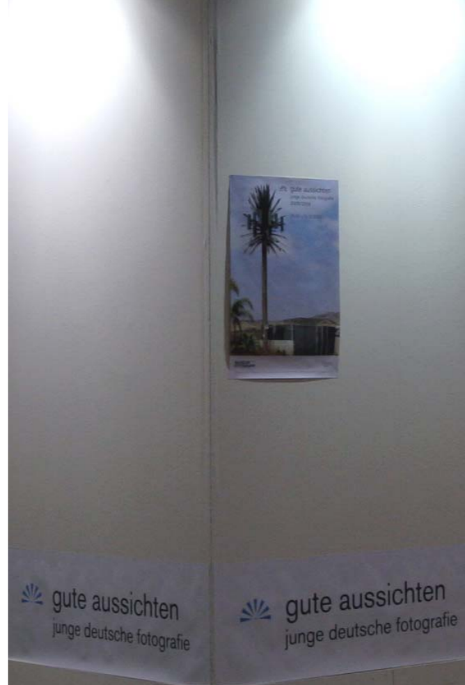
Frankfurter Buchmesse gute aussichten, Halle 5.1 B 971